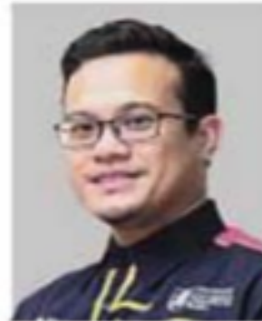
Pensyarah Kanan Jabatan Teknologi dan Pengajian Rantaian Bekalan, Fakulti Pengurusan dan Perniagaan Universiti Teknologi MARA (UiTM) Kampus Puncak Alam

Keperluan mobiliti (bergerak dari satu tempat ke tempat lain), penting dalam kehidupan harian manusia. Ia membolehkan seseorang bukan sahaja mendapatkan akses kepada keperluan asas seperti makanan, pakaian dan perubatan, tetapi kehendak hidup lain.