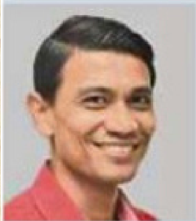
Pensyarah Kanan Jabatan Ekonomi dan Pengajian Kewangan, Fakulti Pengurusan dan Perniagaan Universiti Teknologi MARU (UiTM) Puncak Alam