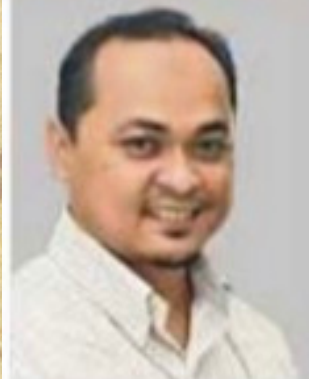
Pensyarah di Jabatan Ekonomi dan Pengajian Kewangan, Fakulti Pengurusan dan Perniagaan, Universiti Teknologi MARA (UITM) Puncak Alam

Kehadiran varian baharu COVID-19 dikenali Omicron mengejutkan dunia dan dalam konteks Malaysia, apakah kehadiran varian membimbangkan (VOC) ini berpotensi merencatkan proses pemulihan sosioekonomi yang sedang berjalan?