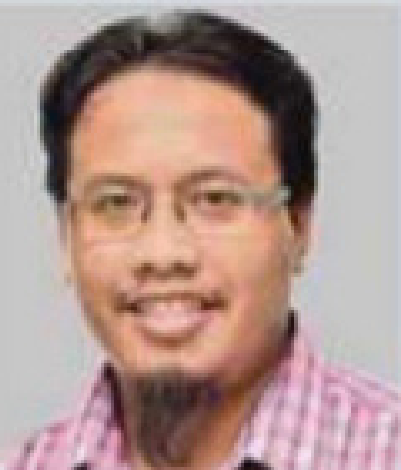
Pensyarah Takaful dan Kewangan Islam di Fakulti Pengurusan dan Perniagaan, Universiti Teknologi MARA (UiTM)