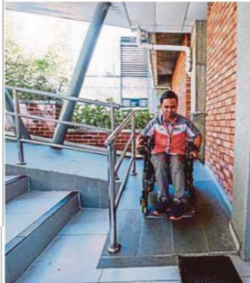
Penyediaan laluan khas membantu memudahkan pergerakan golongan OKU. (Foto hiasan)

Antaranya, tanggungan sepenuhnya bayaran Lesen Kenderaan Motor (LKM) kepada semua kelas kenderaan persendirian milik OKU dan peruntukan RM30 juta bagi menaik taraf infrastruktur bangunan kerajaan supaya lebih universal dan mesra OKU, seperti laluan khas untuk OKU penglihatan.