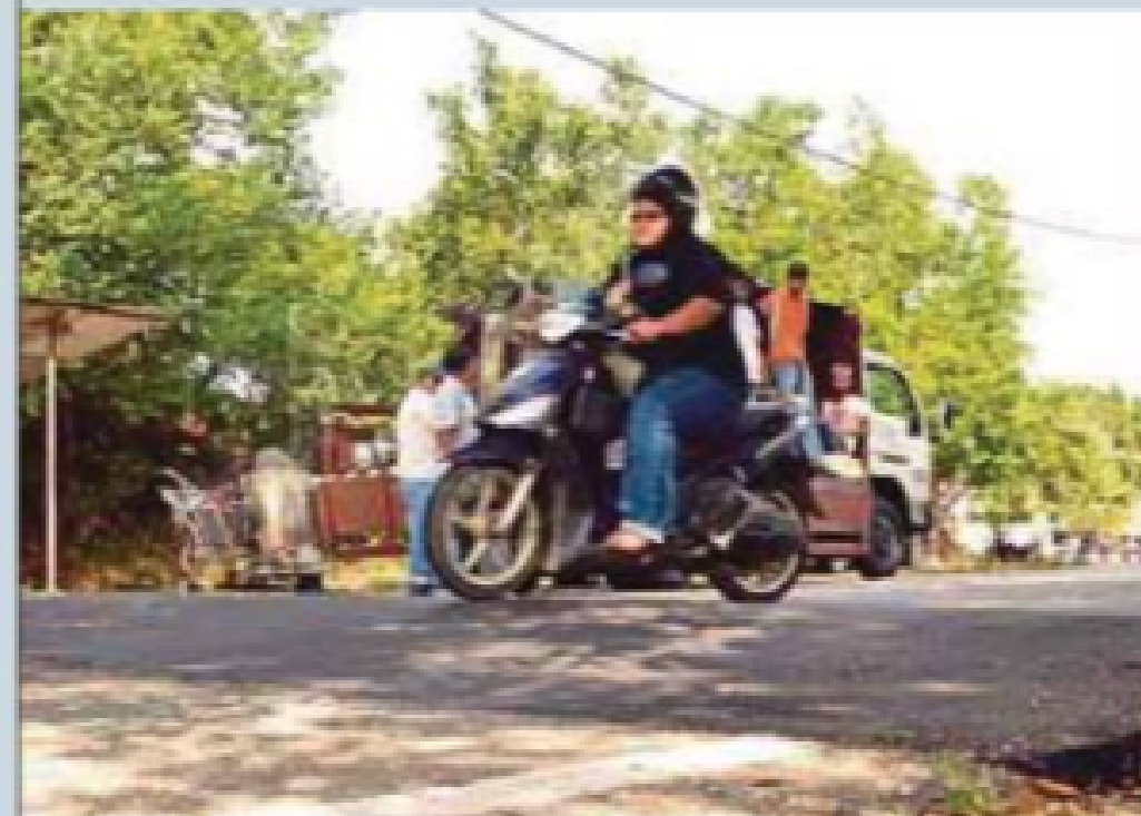
Bonggol jalan perlu mengikut garis panduan ditetapkan bagi mengelakkan risiko kemalangan. (Foto hiasan)

Apa yang membimbangkan, ada segelintir pihak sewenang-wenangnya mengambil tindakan membina bonggol sendiri. Tindakan ini menjurus kepada bonggol jalan dibina tidak seragam, gagal menepati spesifikasi teknikal dan mendatangkan risiko kemalangan.