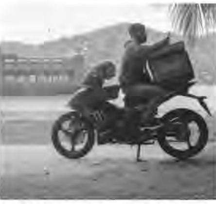
APLIKASI penghantaran makanan dalam talian membolehkan industri restoran bertahan ketika Covid-19.