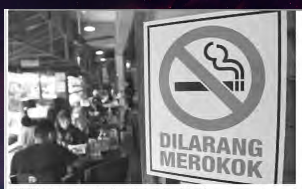
MEROKOK adalah antara punca kepada masalah kesihatan pada hari ini.