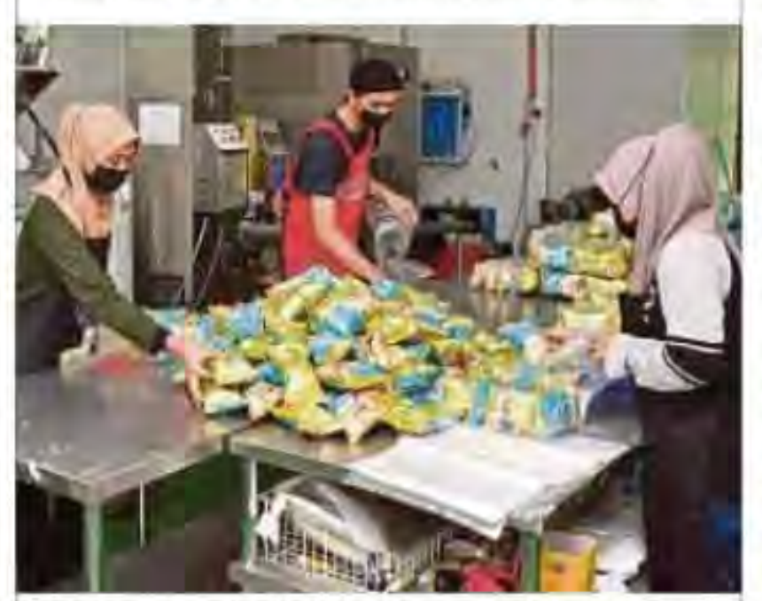
Pekerja menyambut baik kenaikan gaji minimum, namun kebanyakan majikan masih belum bersedia.

Namun, kenaikan gaji minimum yang melalui proses perundangan itu agak sukar diingkari. Ini ditegaskan Presiden Kongres Kesatuan Sekerja Malaysia (MTUC), Datuk Abdul Halim Mansor ba-