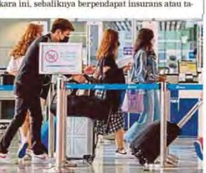
Ambil insurans atau takaful apabila bercuti ke luar negara sebagai 'penyelamat' ketika musibah. (Foto hiasan)

Namun, ramai sering salah faham dengan perkara ini, sebaliknya berpendapat insurans atau ta-