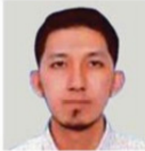
Pensyarah Kanan di Jabatan Teknologi dan Pengajian Rantaian Bekalan, Fakulti Perniagaan dan Pengurusan, Universiti Teknologi MARA (UITM)