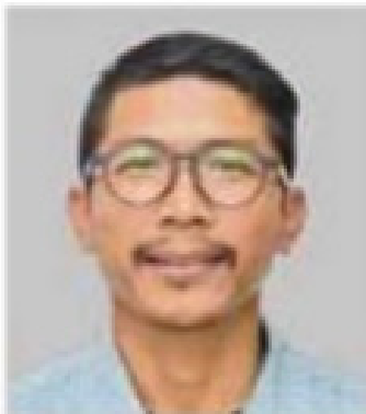
Pensyarah Kanan Jabatan Teknologi dan Pengajian Rantai Bekalan, Fakulti Pengurusan dan Perniagaan Universiti Teknologi MARA (UITM) Kampus Puncak Alam