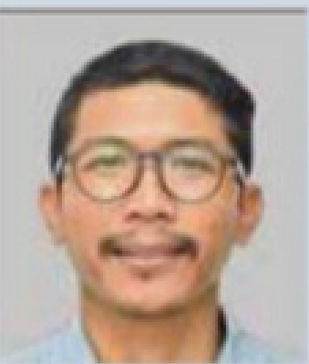
Pensyarah Kanan Jabatan Teknologi dan Pengajian Rantalan Bekalan, Fakulti Pengurusan dan Perniagaan, Universiti Teknologi MARA (UITM) Kampus Puncak Alam