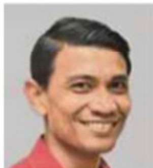
Pensyarah Kanan Jabatan Ekonomi dan Pengajian Kewangan, Fakulti Pengurusan dan Perniagaan, Universiti Teknologi MARA (UITM) Puncak Alam