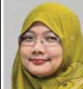
Pensyarah Kanan Fakulti Pengurusan dan Perniagaan, Universiti Teknologi MARA (UiTM)

Pembukaan lebih banyak Pusat Pemberian Vaksin (PPV) antara usaha digerakkan kerajaan untuk kapasiti Program Imunisasi COVID-19 Kebangsaan.