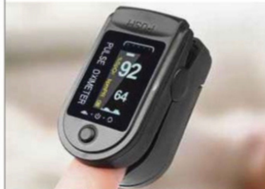
Orang ramai perlu memilih peranti kesihatan berdaftar bagi memastikan ketepatan bacaan. (Foto hiasan)

Peranti perubatan tidak berdaftar secara rasmi