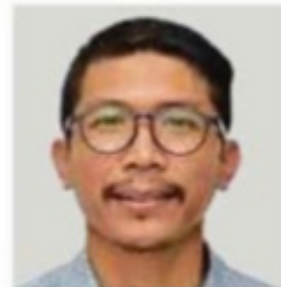
Pensyarah Kanan Jabatan Teknologi dan Pengajian Rantaian Bekalan, Fakulti Pengurusan dan Perniagaan, Universiti Teknologi MARA (UiTM) Kampus Puncak Alam

Oleh Dr Mohd Hafiz Zulfakar bhrencana@bh.com.my