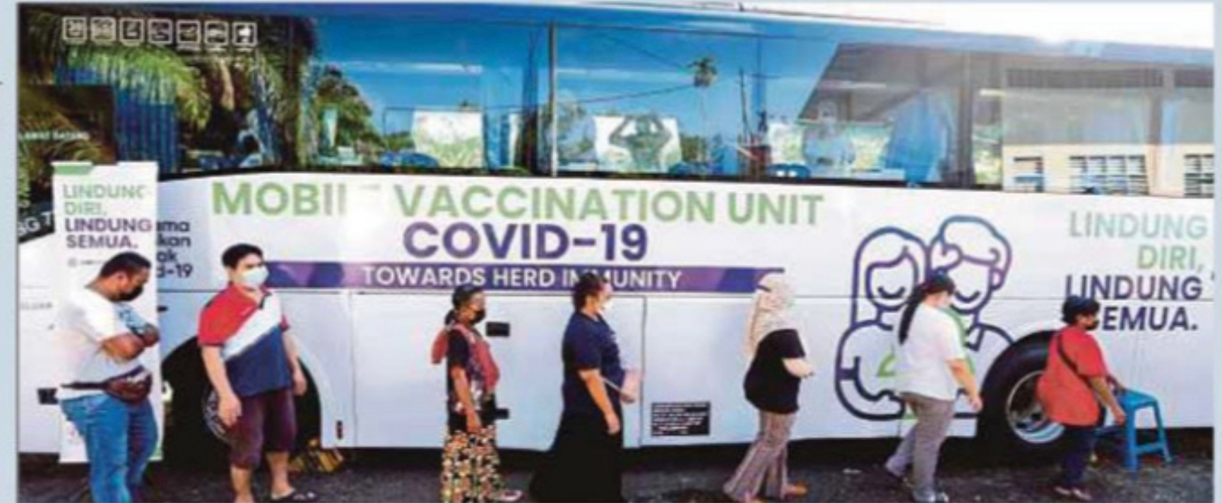
PPV bergerak bas MARA Liner dapat mempercepatkan lagi usaha kerajaan mencapai imuniti kelompok. (Foto hiasan)

Untuk meyakinkan 200,000 masyarakat Orang Asli di seluruh Semenanjung menerima vaksin, KPLB memulakan pendekatan dengan memberi vaksin pelalian COVID-19 kepada Tok Batin selaku pemimpin masyarakat itu. Langkah ini berjaya menyuntik ke-