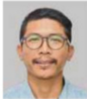
Pensyarah Kanan Jabatan Teknologi dan Pengajian Rantaian Bekalan, Fakulti Pengurusan dan Perniagaan, Universiti Teknologi MARA (UiTM) Kampus Puncak Alam

Oleh Dr Mohd Hafiz Zulfakar bhrencana@bh.com.my