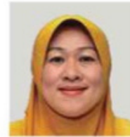
Pensyarah Kanan di Jabatan Ekonomi dan Pengajian Kewangan, Universiti Teknologi MARA (UiTM) Kampus Puncak Alam

Oleh Dr Zahariah Sahudin bhrencana@bh.com.my