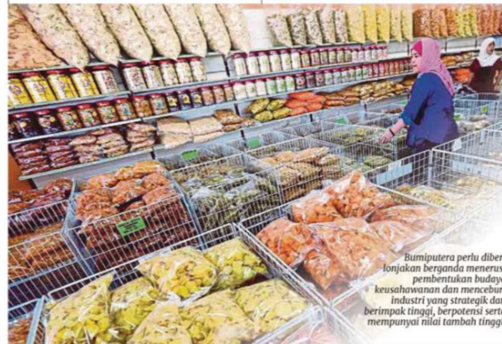
Bumiputera perlu diberi lonjakan berganda menerusi pembentukan budaya keusahawanan dan menceburi industri yang strategik dan berimpak tinggi, berpotensi serta mempunyai nilai tambah tinggi.

“Masalah kekurangan pembiayaan, produktiviti rendah dan kekangan akses kepada teknologi menyebabkan mereka takut mengambil risiko dan terlalu bergantung bantuan kerajaan”