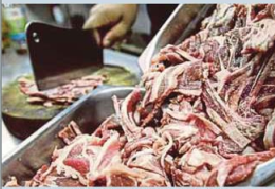
Daging yang tidak sahih status halal menimbulkan keraguan khususnya kepada umat Islam. (Foto hiasan)

Skandal kartel daging ini boleh diatasi dengan ker-